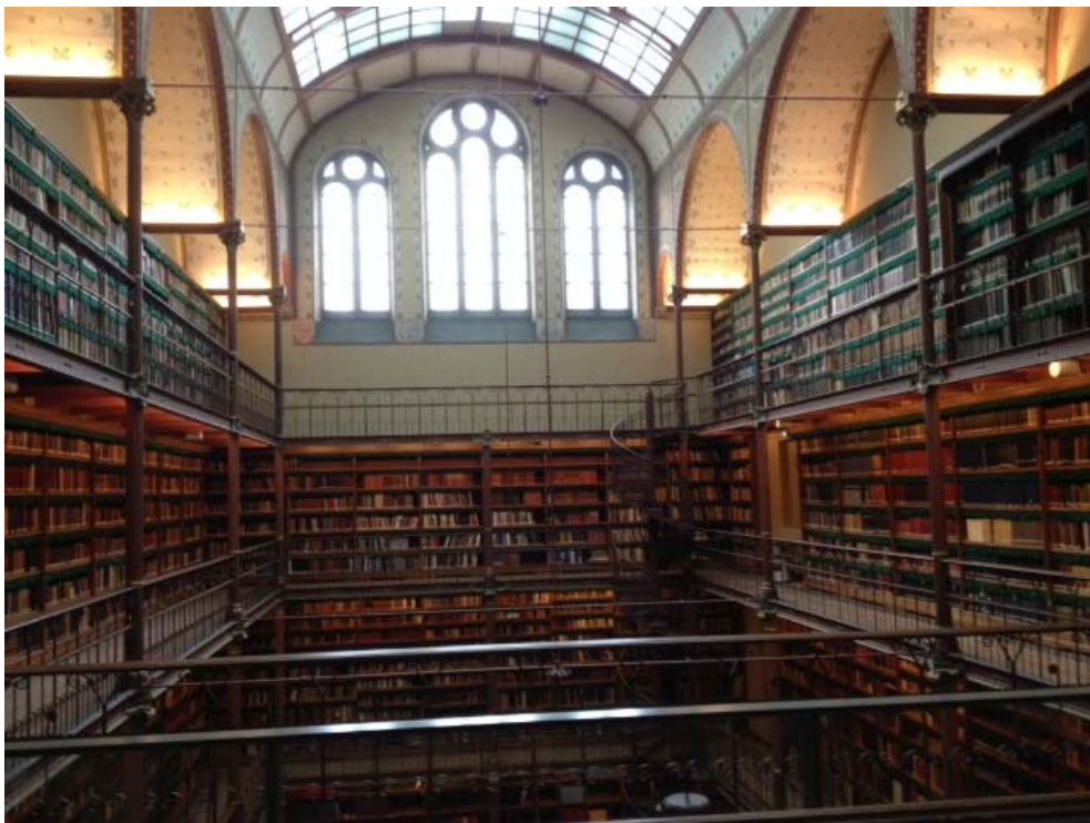
Rijksmuseum 19 november 2013, Bibliotheek