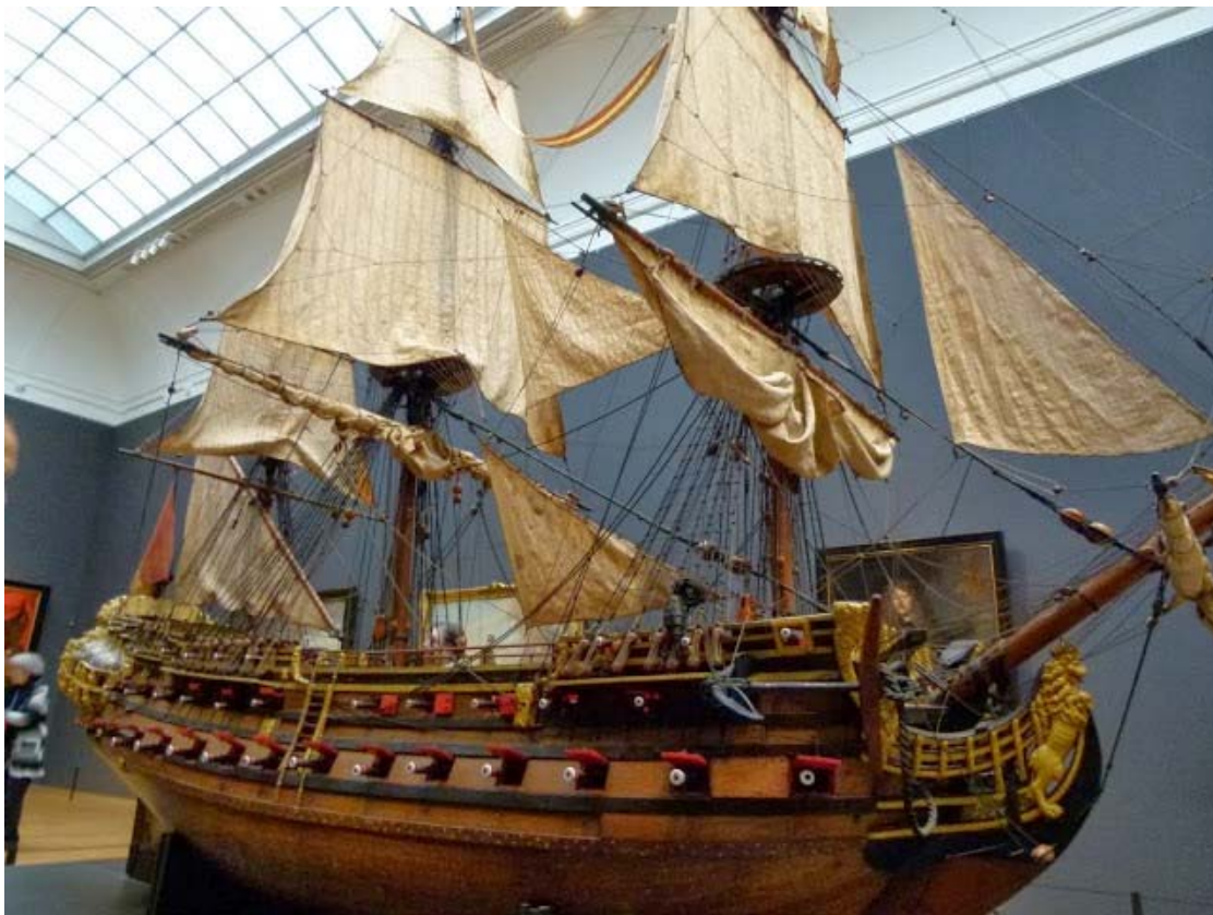
Rijksmuseum 19 november 2013, SCHEEPSMODEL