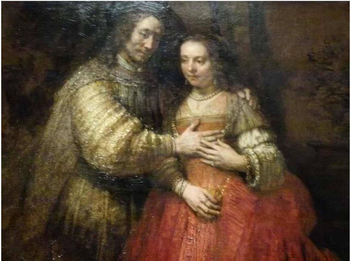
Rijksmuseum 19 november 2013, Rembrandt: HET JOODSE BRUIDJE