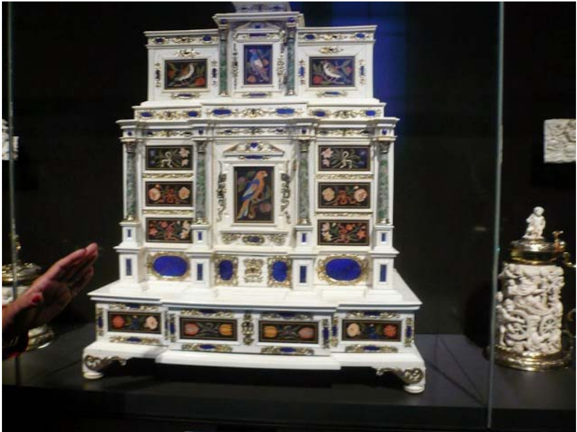
Rijksmuseum, 19 november 2013