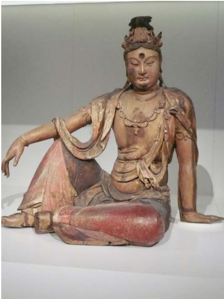
Rijksmuseum 19 november 2013, Aziatisch Paviljoen: GUANYIN