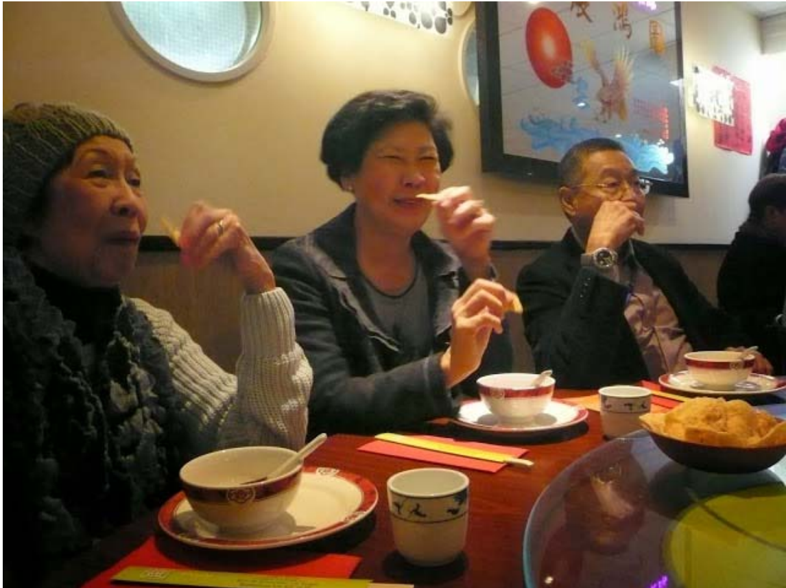
Restaurant Taste of Culture, Dimsum lunch 19 november 2013