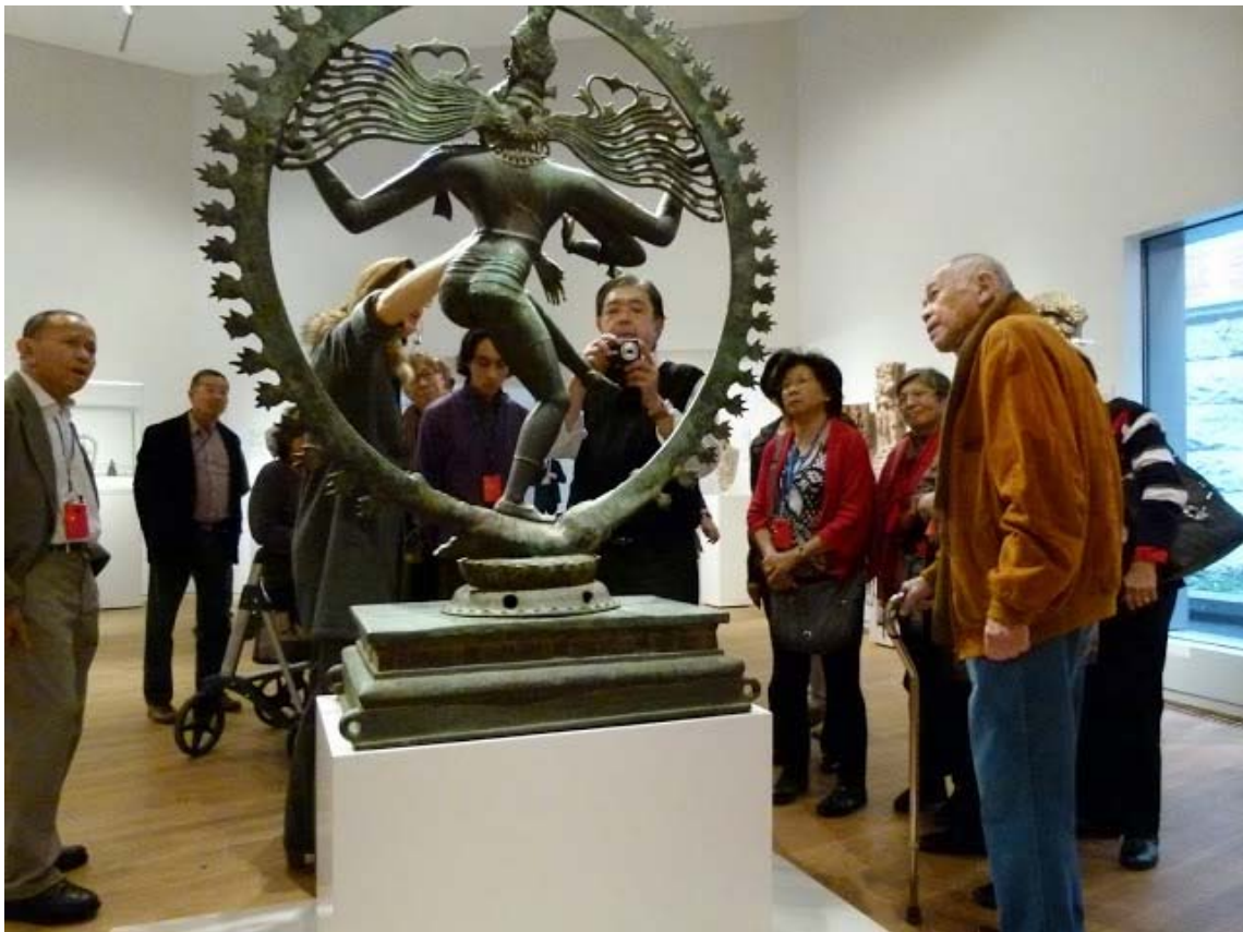
Rijksmuseum 19 november 2013, Aziatisch Paviljoen, SHIVA