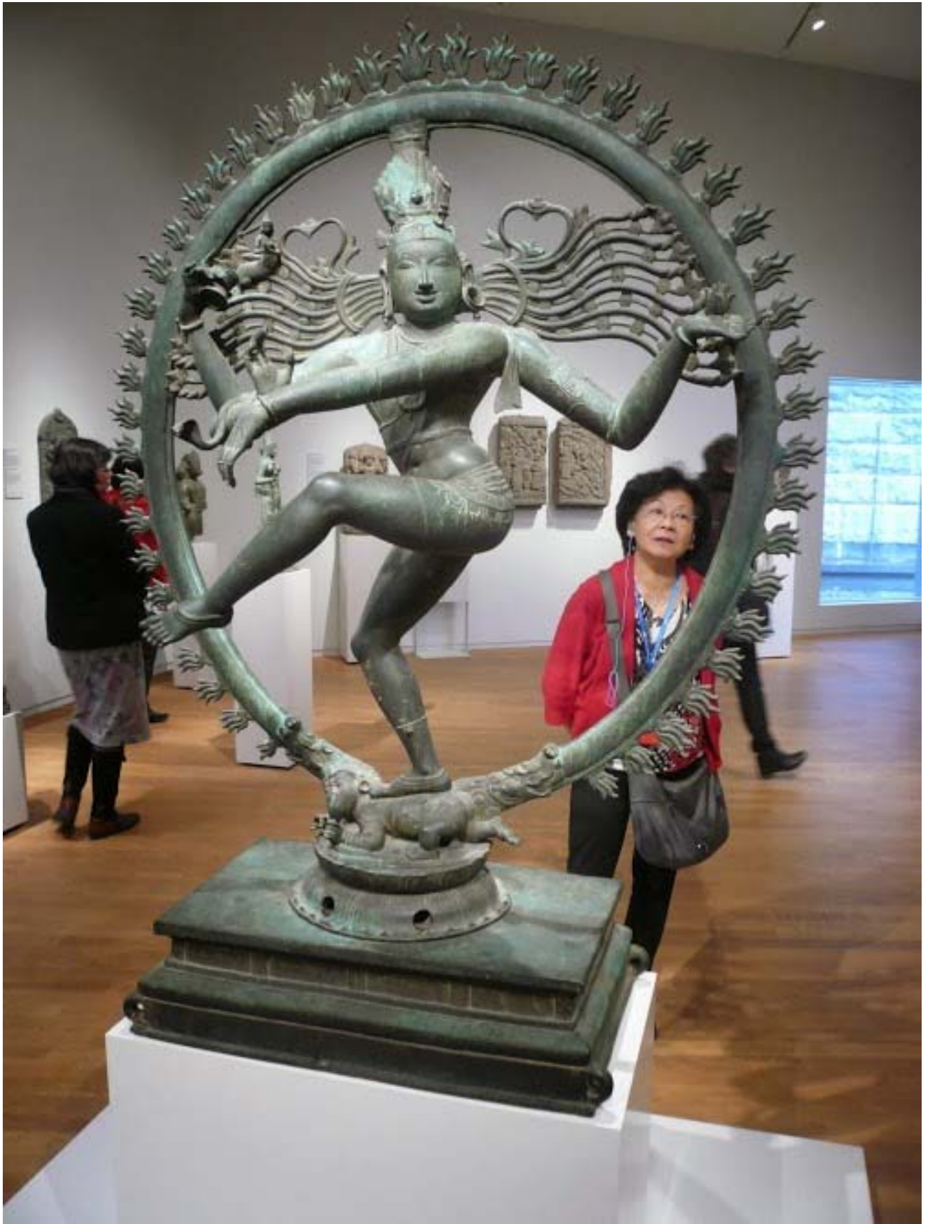
Rijksmuseum 19 november 2013, Aziatisch Paviljoen: SHIVA NATARAJA