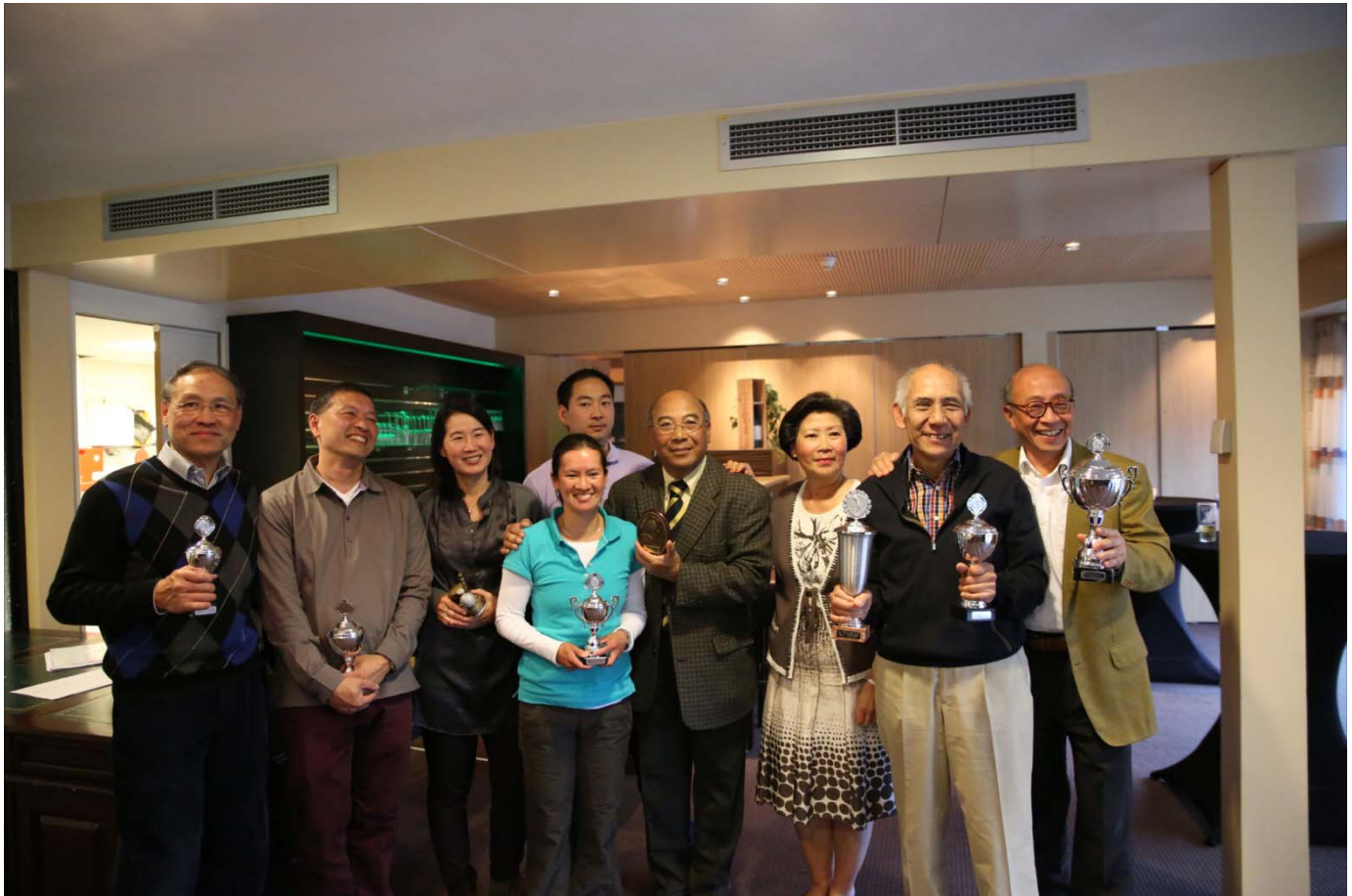
Golfdag 10 mei 2013